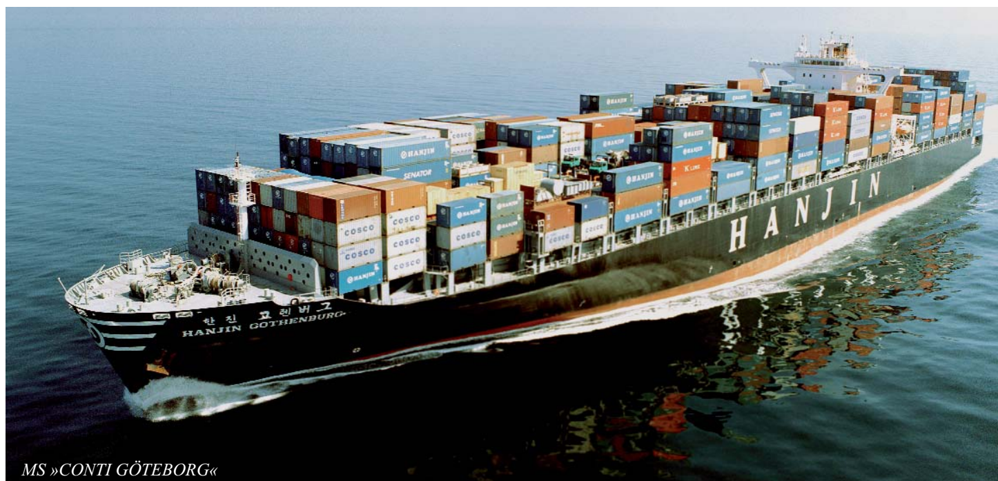
MS »CONTI GÖTEBORG«