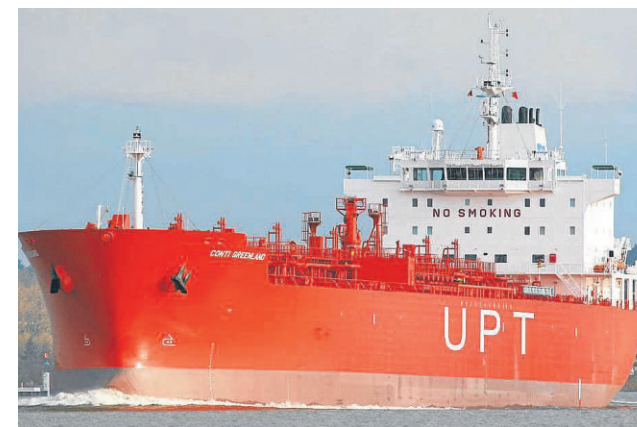
Die Greenland ist einer von zehn Tankern der Münchner.

Zudem setzt die Natur den Auswüchsen des Schiffsbaus Grenzen. Beim Tiefgang sei man tideabhängig, erklärt Conti-Sprecher Lewark. Bei über 13 Metern könne man den Hamburger Hafen zum Beispiel nur während der Flut anfahren. Auch dürften Schiffe auf bestimmten Routen nicht breiter als der Panama-Kanal sein – das Nadelöhr in Mittelamerika und gleichzeitig die Verbindungsstraße zwischen Atlantik und Pazifik. Die dortigen Schleusen sind rund 30 Meter breit. Außerdem seien die Krananlagen in den Häfen, mit denen Schiffe be- und entladen, auf maximal 62 Meter